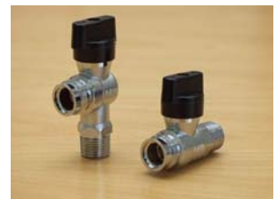
RAM gaskogelkraan met Gastec QA keur