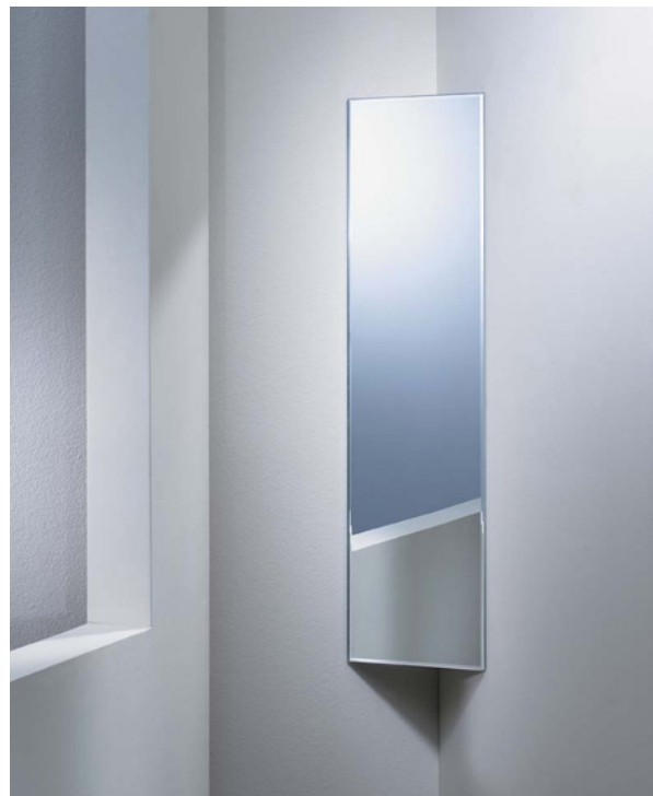
Art.nr. 61.0046 Hoekspiegel 800 x 200 mm met 5 mm facetrand